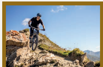
NEU in Samnaun: Die Bikeschule

A uch für Familien ist das Angebot gross – unser absolutes Highlight für Grosse und Kleine Gäste ist der interaktive und abenteuerliche Märchenweg. Erleben Sie die Geschichte von Samnaun hautnah, lassen Sie sich von Waldfeen verzaubern und entdecken Sie die Murmeltier-Familie Murmina und Murmin.