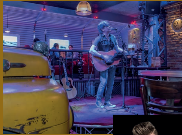
El Rico Club & Bar

S teakhouse & Burger at its best im American Dinner El Rico. Egal ob grosser Appetit oder für den kleiner Hunger zwischendurch: Das Steakhouse & Burger American Dinner El Rico ist ein beliebter Treffpunkt für die ganze Familie und auch bei der jungen Generation äusserst populär. Geniessen Sie die kulinarischen Köstlichkeiten der amerikanischen Küche im stil-echten Ambiente und lassen Sie sich nach El Rico-Art verwöhnen. Im American Dinner El Rico finden Sie alles, was das Herz begehrt – vom klassischen Burger über Veggie Corner bis hin zum saftigen Steak. Aber auch das Nachtleben kommt im El Rico Club & Bar nicht zu kurz: Ob lustiger Mädelsabend, unterhaltsame Männerrunde oder Cocktail-Night mit den Liebsten – bei El Rico ist jeder herzlich willkommen. Stimmungsvolle Musik rundet das Erlebnis optimal ab und lässt Ferienfeeling aufkommen. Eines ist gewiss: Die Location ist definitiv einen Besuch wert!